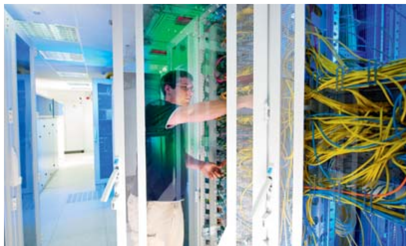
Das leistungsstarke Rechenzentrum ist die Grundlage für das aktuelle M+M-Dienstleistungsangebot; es wurde im Jahr 2007 eingeweiht.

Gemeinsam mit der Solinger Beratungsgesellschaft X-Chain bietet Meyle+Müller ein Full-Service-Angebot für E-Commerce und Online-Marketing-Aktivitäten an. Durch die Kooperation wird von der Konzeption bis hin zur Webshop-Befüllung alles aus einer Hand angeboten.