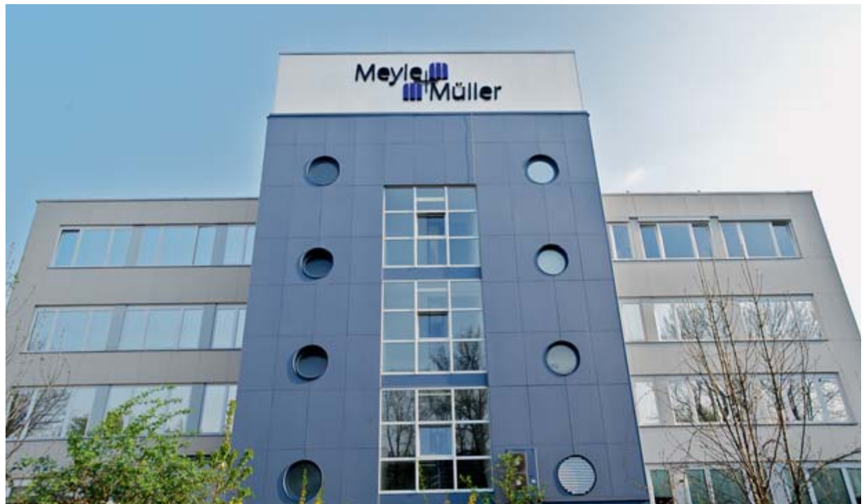
Das Firmengebäude in der Maximilianstraße 104 in Pforzheim.

Am 1. April feierte der Online- und Pre-Media-Dienstleister